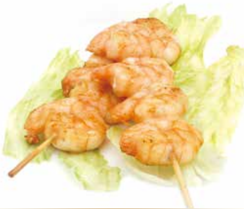
YAKI EBI spiedini di gamberi*