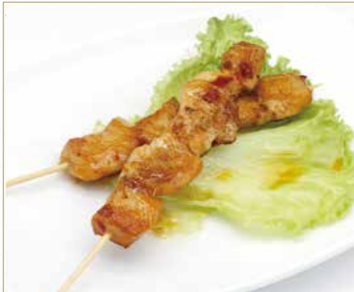
YAKI TORI LIMONE spiedini di pollo al limone