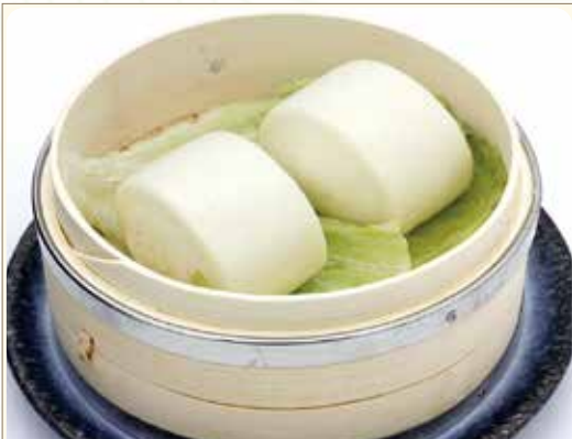
PANE CINESE* AL VAPORE