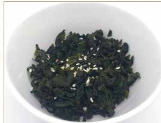
WAKAME insalata di alghe nori