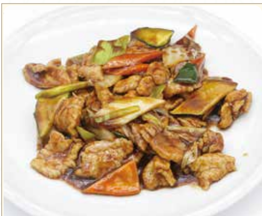
MANZO SALTATO CON VERDURE