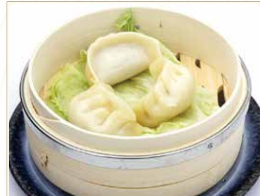
NIKU GYOZA* ravioli di carne