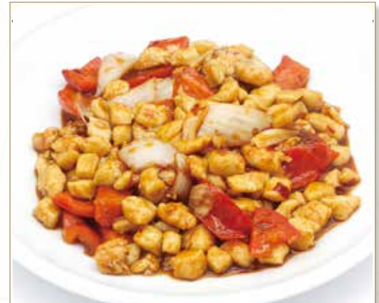
POLLO IN SALSA PICCANTE