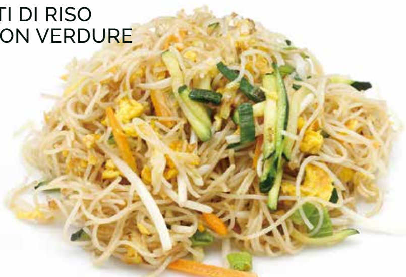
SPAGHETTI DI RISO SALTATI CON VERDURE E UOVA