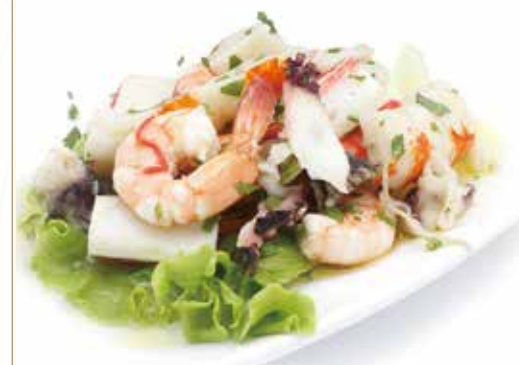
INSALATA DI MARE