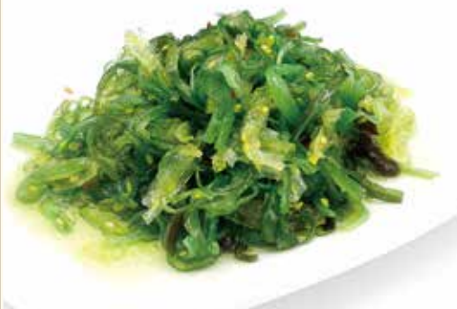
GOMA WAKAME* insalata di alghe piccanti