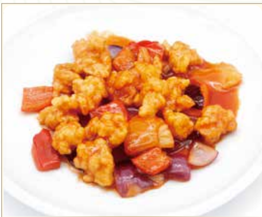
POLLO IN AGRODOLCE