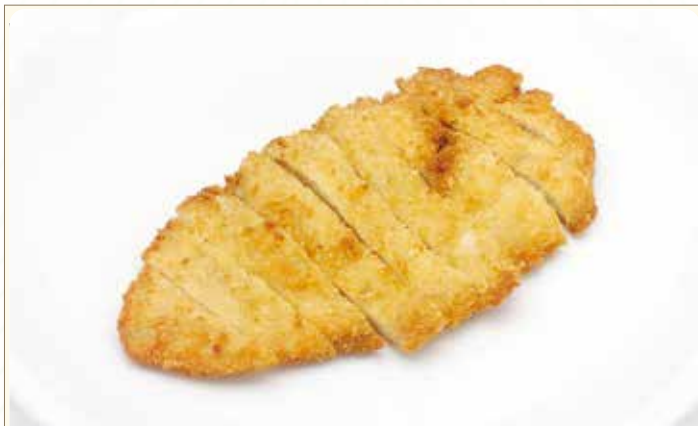
TORI cotoletta di pollo fritto