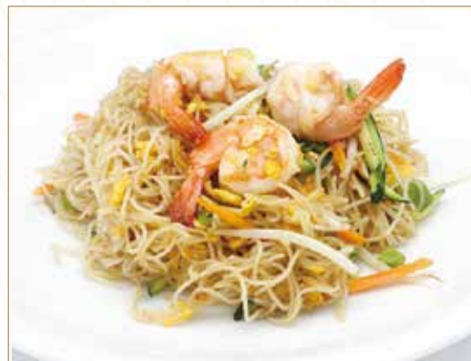
SPAGHETTI DI RISO CON GAMBERI* E VERDURE SALTATI CON UOVA