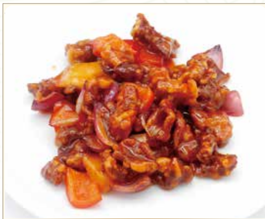
MAIALE IN AGRODOLCE