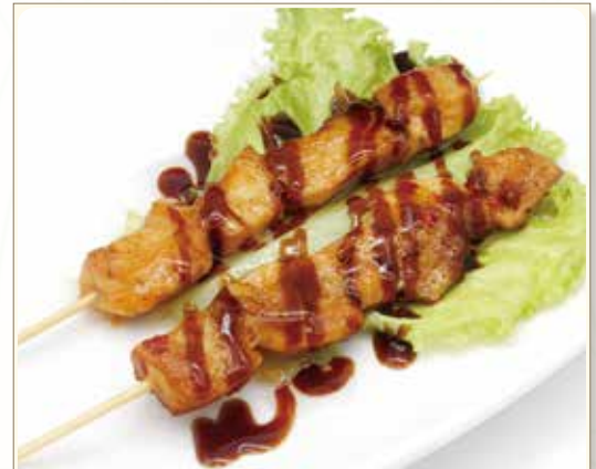
YAKI TORI TERIYAKI spiedini di pollo in salsa teriyaki