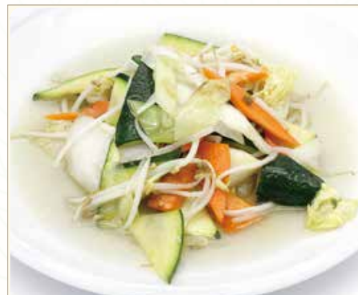
MISTO DI VERDURE SALTATE