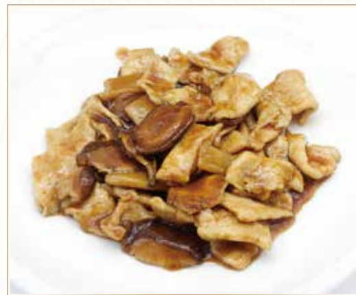
MAIALE BAMBÙ E FUNGHI