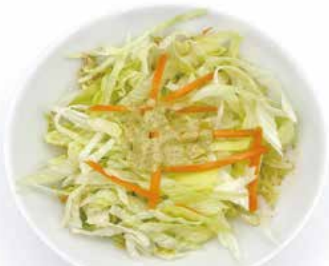
INSALATA MISTA con salsa alla menta