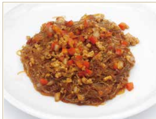
SPAGHETTI DI SOIA PICCANTI SALTATI CON CARNE