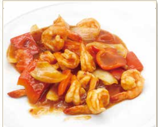
GAMBERI* IN SALSA PICCANTE