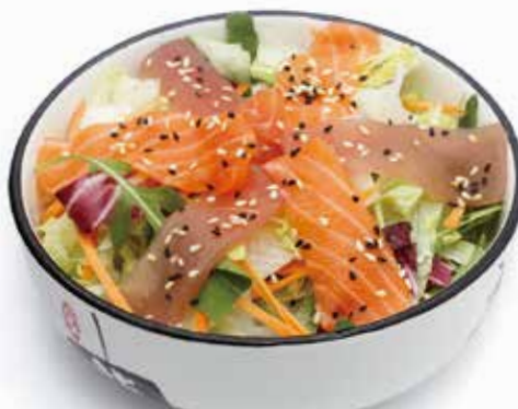
SHIROMI INSALATA pesce crudo insalata