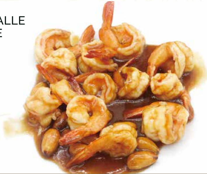
GAMBERI* ALLE MANDORLE