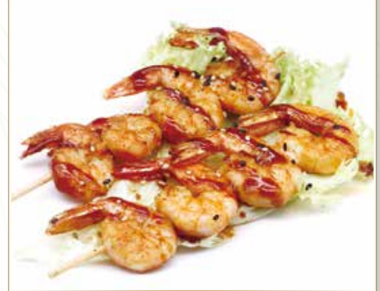
YAKI EBI TERIYAKI spiedini di gamberi* in salsa teriyaki