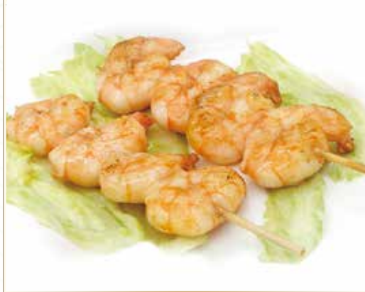
YAKI EBI LIMONE spiedini di gamberi* al limone