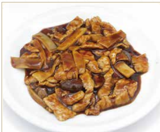
VITELLO BAMBÙ E FUNGHI