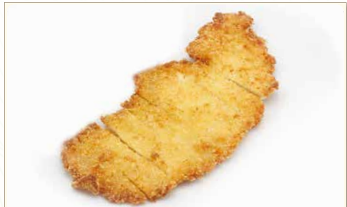
TONKATSU cotoletta di maiale fritto