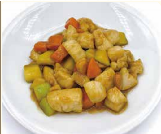
POLLO ALLE MANDORLE