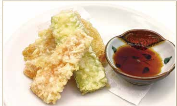
YASAI tempura di verdure