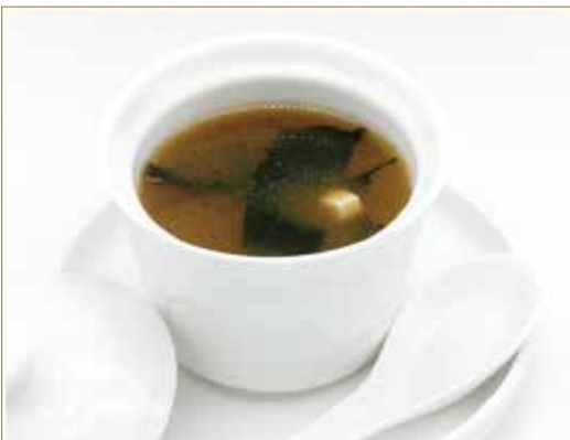
ZUPPA DI MISO