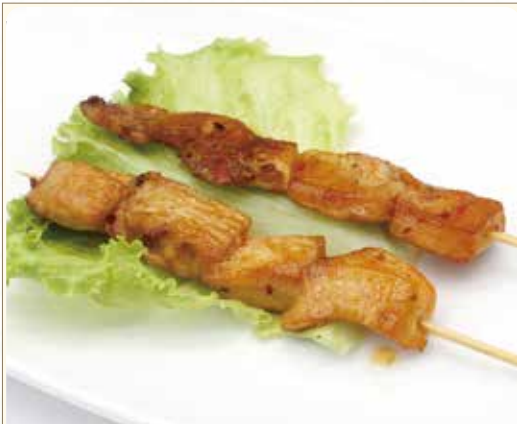
YAKI TORI spiedini di pollo