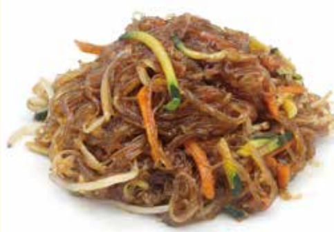
SPAGHETTI DI SOIA CON VERDURE