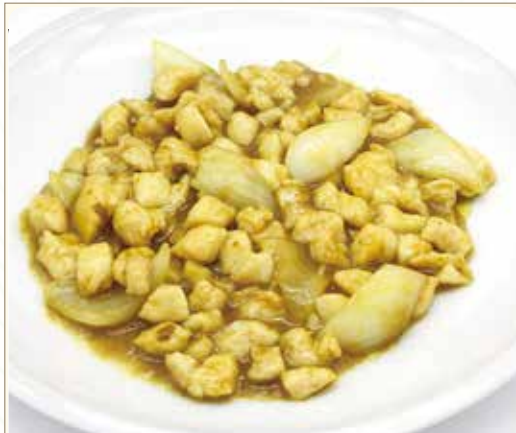
POLLO AL CURRY