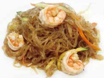
SPAGHETTI DI SOIA CON GAMBERI* E VERDURE