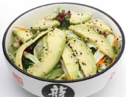
AVOCADO INSALATA insalata avocado