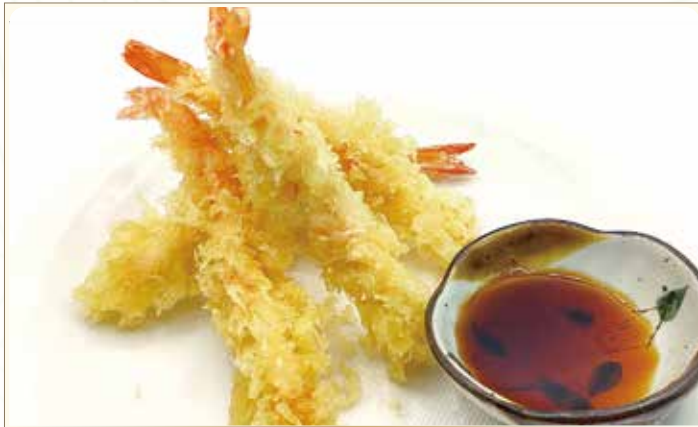
EBI tempura di gamberi*