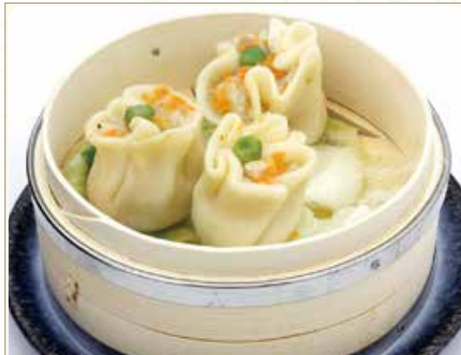
EBI GYOZA* ravioli di gamberi e carne